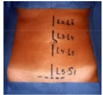
Localisation des cicatrices en fonction du niveau discal opéré

Son objectif est d'enlever le disque malade et de souder les deux vertèbres. Elle se déroule sous anesthésie générale, le chirurgien accède à la colonne vertébrale par une incision sur la partie basse de l'abdomen au milieu ou sur le côté, soit en passant à travers les viscères (voie transpéritonéale) soit à coté d'eux (voie rétropéritonéale). La durée de l'intervention est de deux heures environ. La longueur de l'incision dépend de l'emplacement et du nombre des vertèbres à consolider.